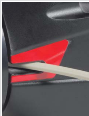
Entrada de la varilla antigiro por ambos lados