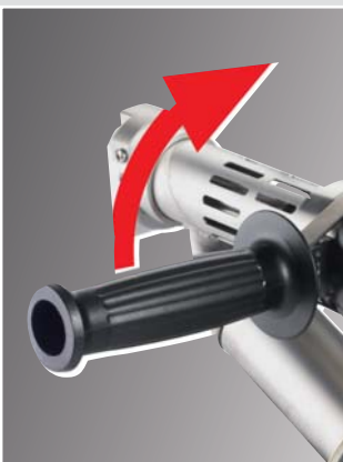
Mango de giro continuo