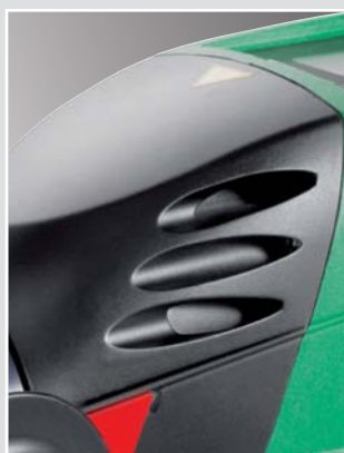
Transmisión potente y silenciosa

La gama incluye otras muchas zapatas de soldadura. ¡Consúltenos!