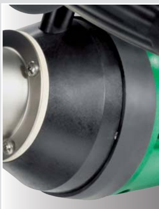
Soplante sin mantenimiento